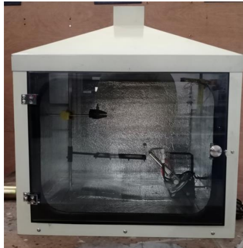
Gambar 1. Alat uji hambat bakar plastik

ditentukan sebagai berikut: Panjang spesimen 150 mm (125 mm standar panjang lintasan bakar), lebar spesimen 13 mm, dan tebal spesimen 3 mm.