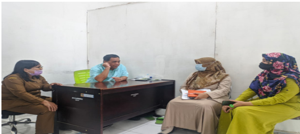
Gambar 2. Tim Pengabdian Sedang Berkoordinasi dengan Bapak Kepala Desa