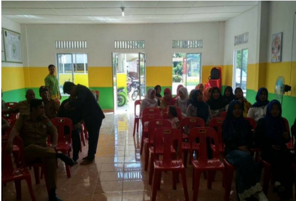
Gambar 3. Masyarakat mendengarkan penyuluh menjelaskan materi mengenai peranan orang tua dalam menumbuh kembangkan minat baca pada anak