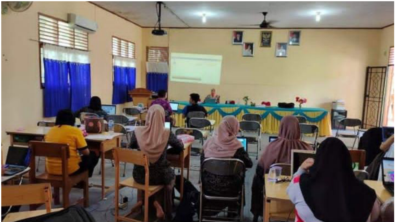
Gambar2. Tempat Kegiatan