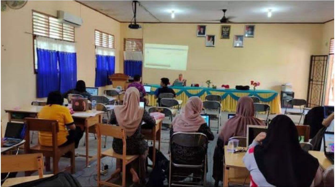
Gambar3. Pelaksanaan Penyuluhan