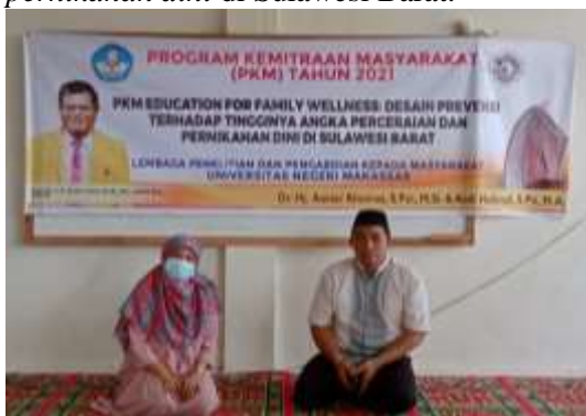
Gambar 1. Pembukaan kegiatan

Sebagai bentuk prevensi terhadap timbulnya tingginya angka perceraian dan pernikahan dini di Sulawesi Barat maka diajukan program yang diberi nama: PKM education for family wellness: desain prevensi terhadap tingginya angka perceraian dan pernikahan dini di Sulawesi Barat.