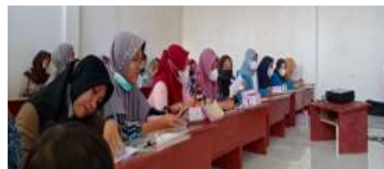
Gambar 2. Peserta menerima Materi

Dalam PKM ini, program education for family wellness berisi materi-materi: 1) makna keluarga dan persiapan dalam pernikahan; 2) peran/fungsi suami istri dalam keluarga; 3) pengasuhan dan pendidikan anak; 4) konflik perkawinan dan KDRT; 5) komunikasi interpersonal dalam keluarga.