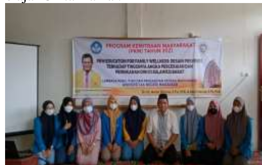
Gambar 6. Panitia pelaksana

Program Education for Family Wellness bermitra dengan BKKBN Wonomulyo, Polman dalam pelaksanaan kegiatan sehingga memudahkan untuk mengumpulkan warga yang sesuai dengan target peserta pengabdian. Kegiatan pengabdian ini juga didukung Rumah Belajar Cinta Damai Kota Parepare dan mahasiswa KKN IAIN kota Parepare yang melaksanakan kegiatan KKN di Rumah Belajar Cinta Damai.