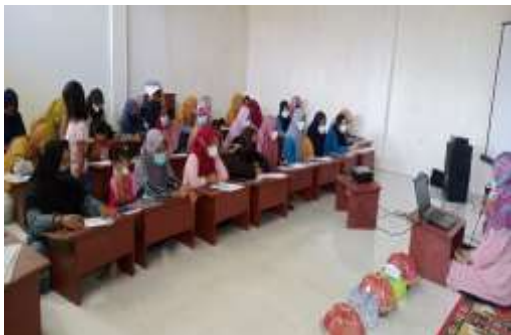
Gambar 4. Peserta mengisi posttest

Pada pelaksanaan program, sekitar 32 peserta menyampaikan pertanyaan terkait permasalahan yang mereka hadapi sehari-hari dalam berumah tangga. Respon peserta menjadi indikator bahwa kegiatan serupa perlu terus diadakan untuk menunjang ketahanan keluarga khususnya di desa yang memiliki angka perceraian yang tinggi. Kegiatan PKM juga melibatkan Staf BKKBN Wonomulyo, Polman dan sangat antusias dalam memfasilitasi pelaksanaan kegiatan tersebut di Desa Wonomulyo.