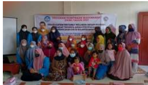
Gambar 5. Peserta dan Panitia

pengasuhan yang baik, dan cara berkomunikasi yang baik dalam keluarga.