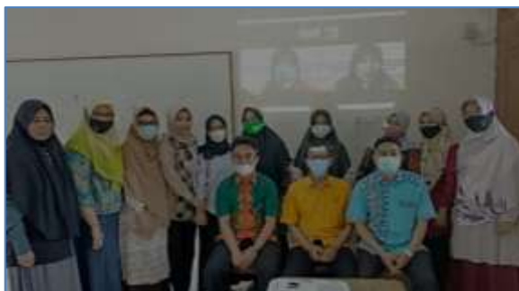
Gambar 2. Foto bersama setelah agenda pelatihan

Program Kemitraan Masyarakat (PKM) ini dilaksanakan dalam bentuk pelatihan pengelolaan pembelajaran berbasis STEM di sekolah. Program ini dilakukan bersama dengan mitra dari Kelompok Kerja Guru (KKG) SD se-Kabupaten Bantaeng yang diwakili oleh 12 orang guru dari berbagai gugus KKG. Kegiatan dilaksanakan secara blended , dimana mitra bersama satu orang anggota tim pengabdian berkumpul di SMPN 1 Bissappu Kab. Bantaeng, sementara dua tim pengabdian lainnya menyampaikan materi secara virtual melalui aplikasi video konferensi zoom .