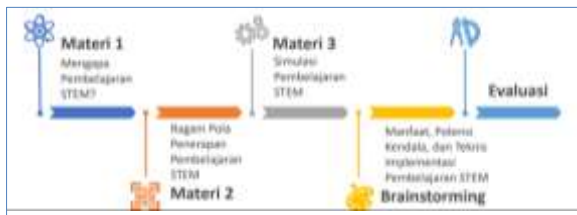
Gambar 1. Alur pelaksanaan PKM

Asyari, dan Khuluq (2020) dengan melakukan penyesuaian terkait konten kajian.