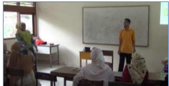
Gambar 7 dan 8. Simulasi pembelajaran STEM (salah satu anggota tim berperan sebagai guru, dan peserta pelatihan menjadi siswa)

Selain simulasi langsung, pada sesi ini, tim juga menayangkan contoh praktek baik ( best practice ) implementasi pembelajaran STEM di sekolah. Kegiatan pembelajaran STEM yang ditampilkan baik dalam simulasi maupun video semuanya menggunakan alat-alat sederhana dalam pembelajarannya. Hal ini dilakukan untuk memotivasi guru dalam berinovasi meski dengan sumber daya yang terbatas.