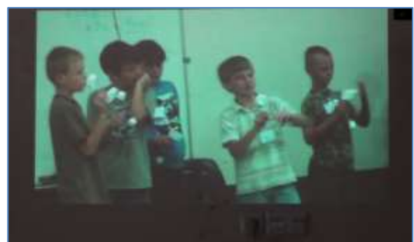
Gambar 9. Cuplikan video pembelajaran STEM yang ditampilkan saat pelatihan

Selain simulasi langsung, pada sesi ini, tim juga menayangkan contoh praktek baik ( best practice ) implementasi pembelajaran STEM di sekolah. Kegiatan pembelajaran STEM yang ditampilkan baik dalam simulasi maupun video semuanya menggunakan alat-alat sederhana dalam pembelajarannya. Hal ini dilakukan untuk memotivasi guru dalam berinovasi meski dengan sumber daya yang terbatas.