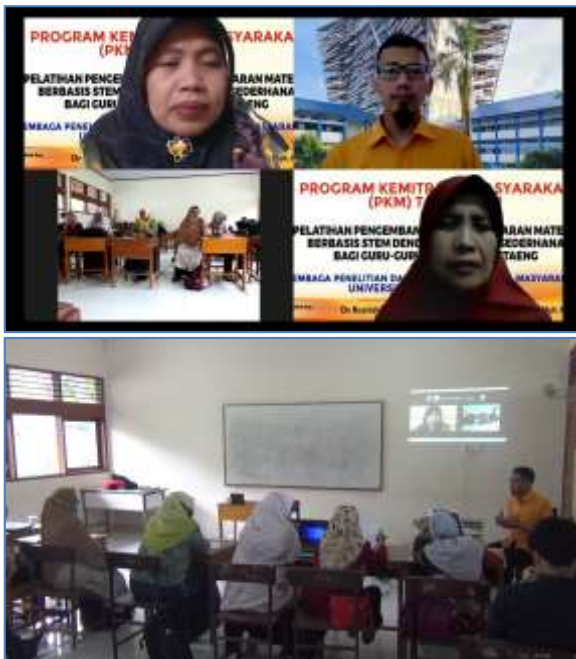
Gambar 10 dan 11. Situasi ruang diskusi dari ruang virtual ( zoom ) dan secara langsung ( luring )

Kegiatan diskusi terbuka ditujukan untuk memberikan kesempatan seluas-luasnya kepada guru mitra untuk menggali informasi mengenai pembelajaran STEM, baik secara teoretis maupun secara praktis. Diskusi dilakukan secara blended .