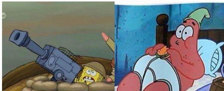
Gambar 2. Meme virus corona

JIKA KAMU PERNAH PUNYA MIMPI UNTUK MENYELAMATKAN JUTAAN ORANG DI DUNIA, TAPI KEAHLIANMU ADALAH REBAHAN.