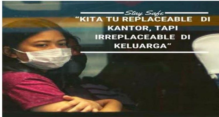
Gambar 1. Meme virus corona