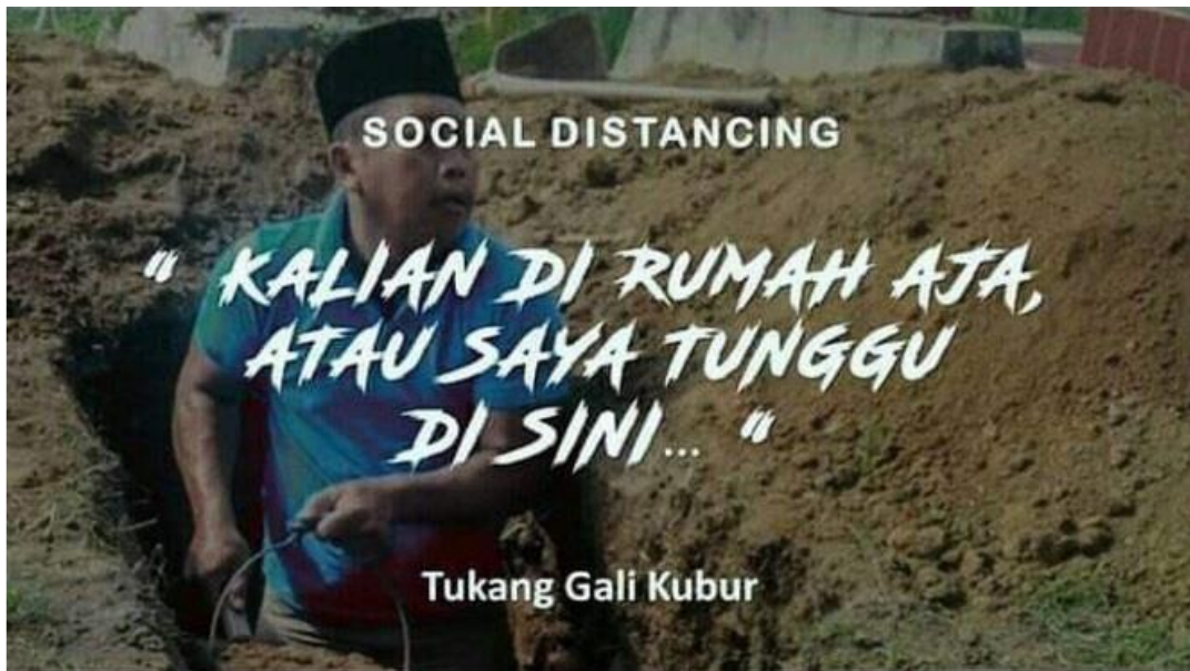
Gambar 4. Meme virus corona

Gambar-gambar tersebut penulis kutip dari situs liputan6.com (Muhammad Fahrur Safi'i, 2020). Gambar pertama unggahan akun twitter @edwin_basuki dan pada gambar 2 unggahan twitter dari akun @sonofsetien, gambar 3 unggahan twitter dari akun twitter @elviantobagus, dan gambar 4 unggahan twitter dari akun @yogantfirman. Dan memang secara realitanya, akun berita yang tersebar di twitter memiliki kepentingan yang mewakili ideologi-ideologi tertentu dengan tujuan: (1) merepresentasikan ideologi dan kekuasaan tertentu, (2) menyampaikan opini publik atau aspirasi masyarakat, (3) keperluan komersial, dan (4) untuk keperluan intertainment (Pendri, 2019). Akun-akun tersebut mengunggah meme dengan tema tema yang sedang viral saat ini, yaitu berkaitan dengan virus corona.