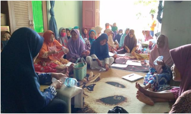
Gambar 1. Praktik pembuatan ovitrap

mendengar istilah ovitrap. Peserta secara aktif melakukan pembuatan ovitrap dengan botol air mineral (Gambar 1).