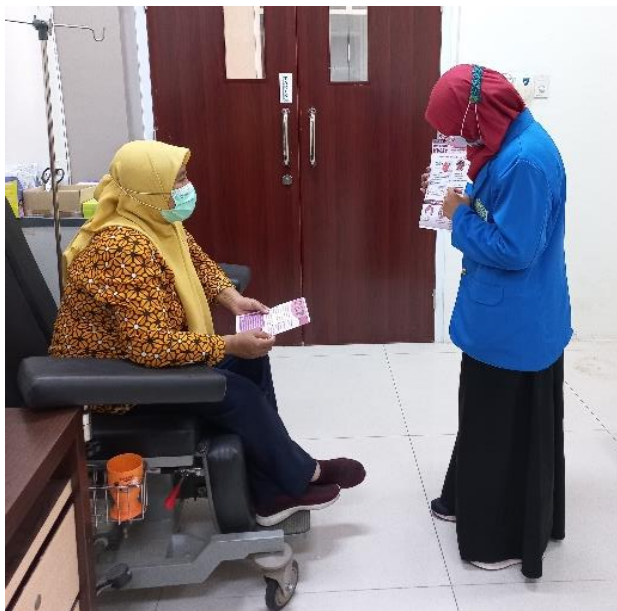
Gambar 1. Kegiatan Penyuluhan

Berdasarkan penyuluhan dan pemeriksaan kadar HbA1c pada penderita Diabetes Mellitus Tipe 2 di RSUD Suradadi, diperoleh jumlah peserta kegiatan sebanyak 10 orang yang terdiri dari 6 orang berjenis kelamin laki-laki dan 4 orang berjenis kelamin perempuan dengan umur diatas 40 tahun. Kemudian sebanyak 7 orang memiliki kadar HbA1c diatas normal dan 3 orang memiliki kadar HbA1c diatas normal.