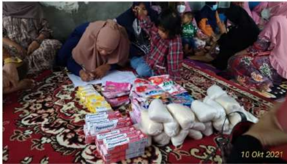
Ket : Antusias Warga yang akan mengadakan acara Doorprise dari Tim Pengabdian.