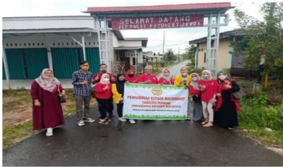
Ket : Foto bersama dengan sebagian anggota kelompok pengabdian