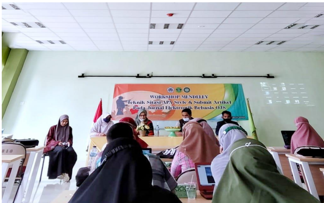
Gambar 1. Persiapan Kegiatan Pelatihan

Persiapan yang dilakukan sebelum kegiatan berlangsung dengan menyiapkan peralatan dan materi yang akan disampaikan serta menyiapkan konsumsi kegiatan pelatihan. Gambaran mengenai persiapan kegiatan pelatihan dapat dilihat pada gambar 1 sebagai berikut.