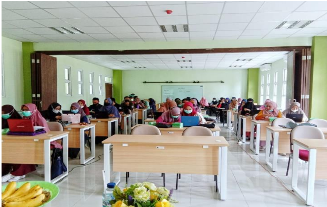
Gambar 3. Aktifitas Peserta dalam Mengikuti Kegiatan Pelatihan

Setelah melakukan manajemen referensi dan sitasi APA style menggunakan software Mendeley, selanjutnya adalah memberikan materi mengenai gambaran umum jurnal ilmiah, cara mencari jurnal yang mudah dan sesuai dengan kajian penelitian serta sekaligus simulasi cara melakukan submit artikel pada jurnal berbasis OJS ( Open Journal System ).