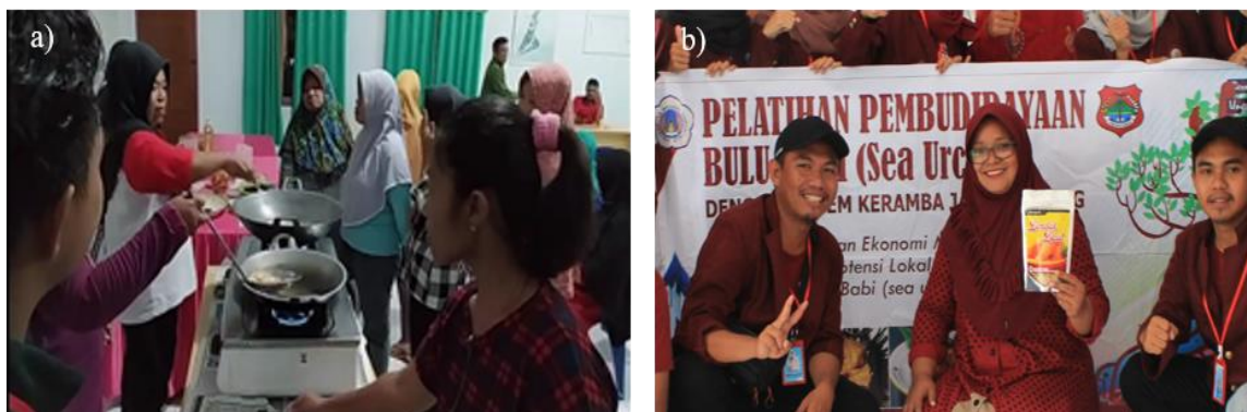
Gambar 3. Diversifikasi olahan landak laut: a) Proses penggorengan kerupuk landak laut; b) kemasan kerupuk telur landak laut yang sudah siap dipasarkan ke konsumen

Pembuatan Kerupuk Landak Laut. Kegiatan diversifikasi olahan pangan dari telur landak laut dilaksanakan untuk menanamkan pengetahuan ibu-ibu nelayan terkait pemanfaatan telur landak laut pasca panen landak laut yang dibudidayakan di KJA. Dengan demikian, rantai kegiatan pembudidayaan landak laut bukan saja hanya dipasarkan secara segar, tapi juga dapat dipasarkan telurnya dalam bentuk olahan kerupuk.