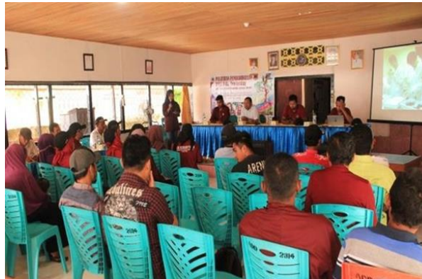
Gambar 1. Edukasi pembudidayaan landak laut

pertanyaan dan respon-respon positif dari para nelayan yang bermaksud mengklarifikasi kesalahan-kesalahan pandangan dan anggapan terkait dengan pengetahuan dan pengalaman-pengalaman mereka selama bersentuhan dengan landak laut khususnya terkait dengan duri landak laut yang informasinya dapat membunuh dan mematikan bila disentuh karena mengandung racun.