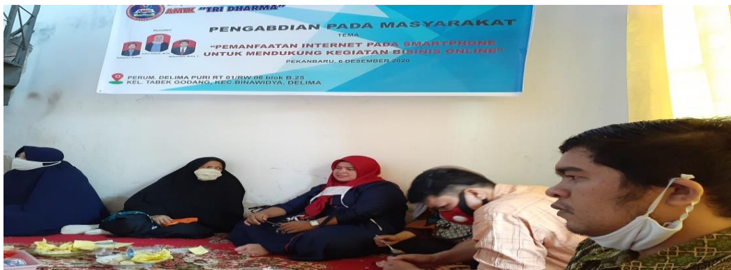
Gambar 1. Dokumentasi Foto Kegiatan

Pada umumnya, terutama ibu-ibu yang hadir yang masih berusia di bawah 50 (lima puluh) tahun, merasa perlu untuk memiliki sebuah usaha yang bisa dipasarkan dengan jaringan yang lebih luas.