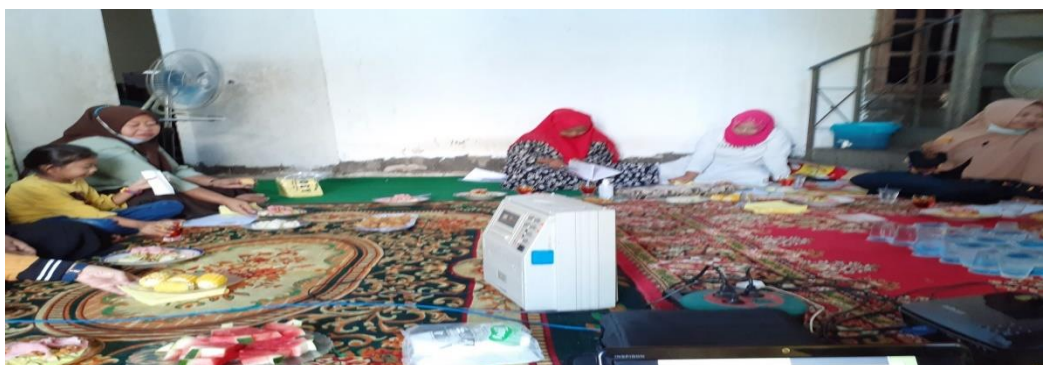
Gambar 3. Dokumentas Foto Kegiatan