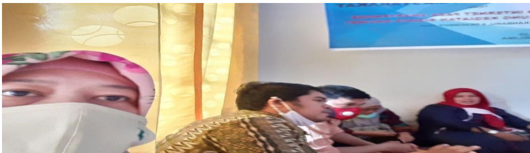
Gambar 2. Dokumentas Foto Kegiatan