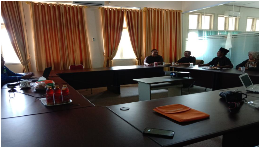
Gambar 3. Tanya jawab peserta dan pemateri