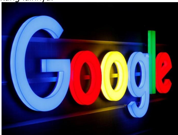
Gambar 1. Aplikasi Google

Google adalah sebuah platform yang bisa dimanfaatkan dalam melakukan pelayanan secara daring oleh stakeholder universitas kepada mahasiswa dan dosen. Beberapa aplikasi yang bisa digunakan adalah google meet dan google classroom sebagai aplikasi pembelajaran daring dan rapat daring, google drive sebagai penyimpanan, google map sebagai aplikasi mapping, google sheet, docs, slide sebagai pengganti aplikasi office, gmail untuk pengiriman surat secara daring, google form sebagai aplikasi kuis daring dan beberapa aplikasi pendukung lainnya.