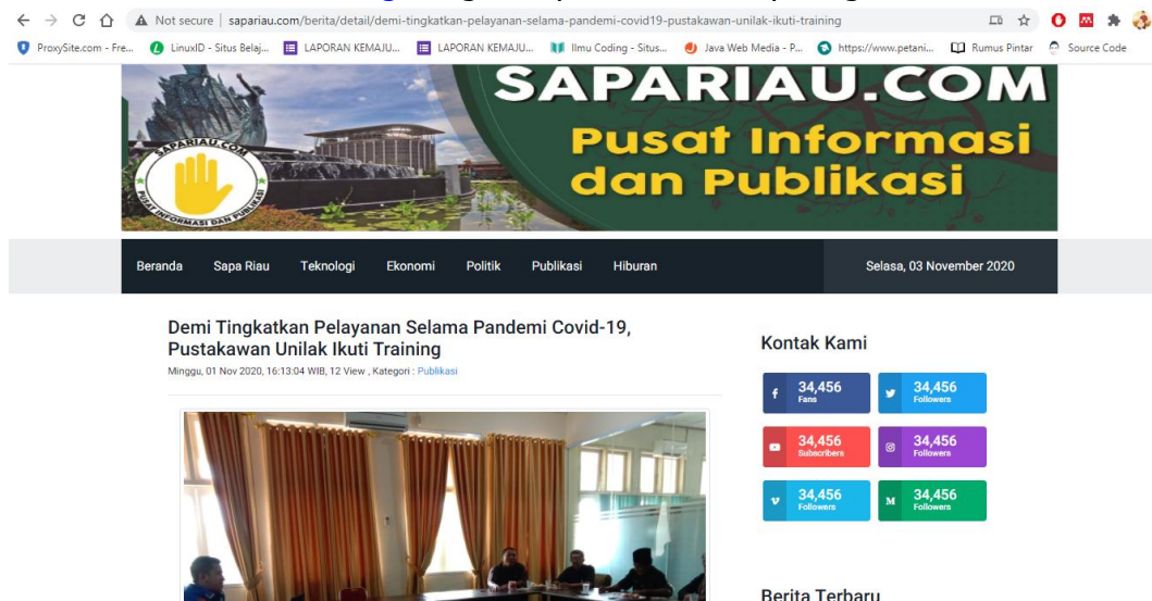
Gambar 6. Publikasi Berita Kegiatan PKM

Kegiatan Pengabdian Kepada Masyarakat berupa berita diterbitkan pada portal berita online www.sapariau.com sebagai luaran dari kegiatan dapat dilihat pada link berita http://sapariau.com/berita/detail/demi-tingkatkan-pelayanan-selama-pandemi-covid19-pustakawan-unilak-ikuti-training dengan cuplikan berita seperti gambar dibawah ini