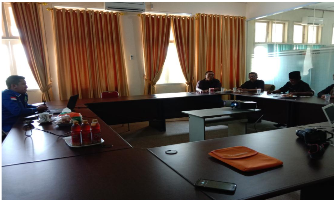
Gambar 2. Suasana saat pelatihan