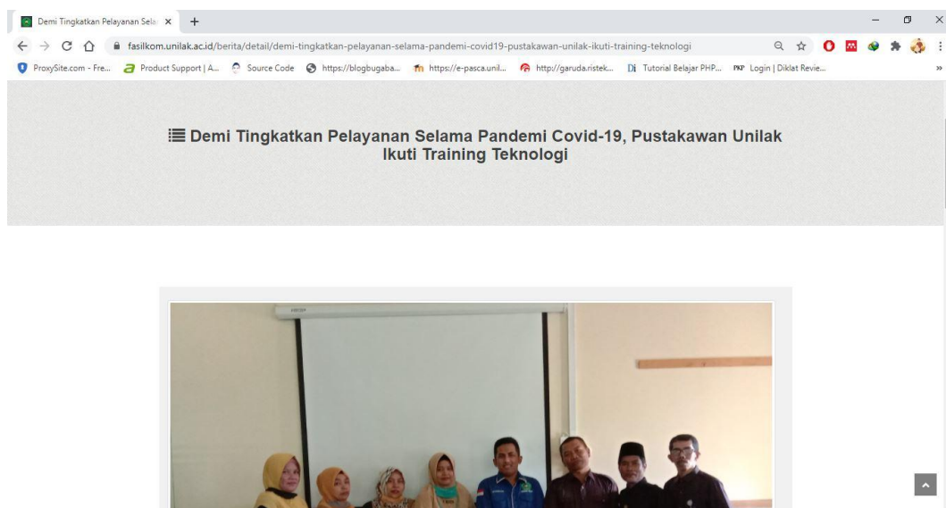
Gambar 4. Publikasi Berita Online Kegiatan PKM

Luaran yang hendak dicapai dari kegiatan Pengabdian Kepada Masyarakat ini adalah berita kegiatan diterbitkan dalam portal berita online. Berita diterbitkan pada website Fakultas Ilmu Komputer Universitas Lancang Kuning www.fasilkom.unilak.ac.id . Berita terbit pada link https://fasilkom.unilak.ac.id/berita/detail/demi-tingkatkan-pelayanan-selama-pandemi-covid19-pustakawan-unilak-ikuti-training-teknologi seperti gambar dibawah ini.