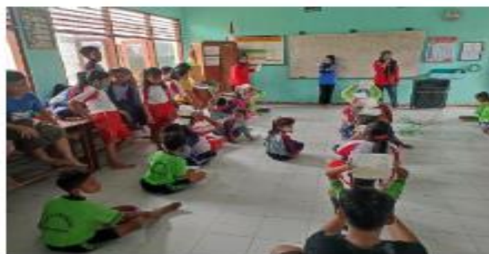
Gambar 3. Kegiatan lomba memperingati hari sumpah pemuda.

Kegiatan edukasi/penyuluhan pentingnya budaya literasi dilakukan dengan mengadakan kegiatan 1 buku 1 siswa 1 bulan. Setiap siswa diminta membaca buku bacaan secara rutin setiap bulan. Buku bacaan tidak dibatasi entah dari jenis fiksi maupun non fiksi. Buku bacaan bisa dari milik pribadi, atau meminjam di perpustakaan sekolah. Mahasiswa juga menghimbau untuk memanfaatkan pojok literasi di setiap sudut ruang kelas untuk memupuk budaya literasi. Pada hari besar nasional, tepatnya di hari pahlawan dan sumpah pemuda diadakan lomba telling story untuk mengetahui perkembangan kemampuan budaya literasi siswa.