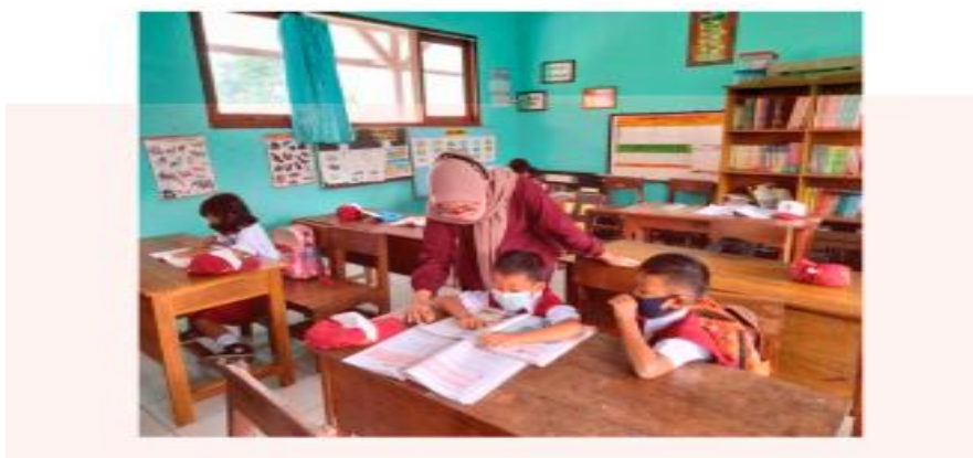
Gambar 4. Kegiatan jam pembelajaran tambahan di SDN 2 Gombang.

Kegiatan jam pembelajaran tambahan, dirasa perlu dilakukan karena kemampuan beberapa siswa di kelas 4-6 belum memenuhi capaian pembelajaran. Peserta dalam kegiatan ini adalah 2 siswa dari kelas 4 dan 5. Siswa diberikan soal dan pemahaman oleh mahasiswa kampus mengajar. Bagi siswa yang belum lancar dalam literasi dan numerasi, akan sulit bagi mereka untuk melanjutkan kegiatan pembelajaran selanjutnya. Karena belum bisa memahami pembelajaran yang di berikan saat itu. Hal ini berpengaruh pada siswa yang belum lancar terhadap literasi dan numerasi. Guru yang tidak telaten dalam pembelajaran pada siswa yang kurang dalam literasi dan numerasi akan menganggap siswa tersebut bodoh dan lambat dalam pembelajaran. Selain itu orang tua yang sudah memasrahkan anaknya untuk belajar di sekolah tidak memperhatikan pembelajaran anak terutama literasi dan numerasi. Hal ini sangat berpengaruh pada nilai siswa yang akhirnya tidak memuaskan.