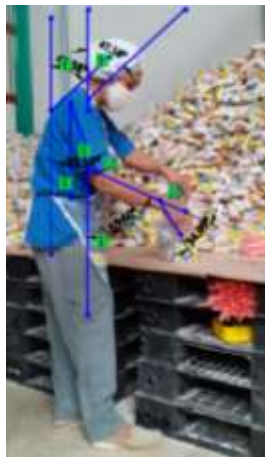
Gambar 1 Foto Postur Kerja Pekerja Pengepakan

Pengumpulan data postur kerja menggunakan foto pada pekerja pengepakan untuk menentukan sudut-sudut pada postur tubuh sikap kerja yang dilakukan oleh pekerja pengepakan. Berikut ini foto postur kerja saat melakukan aktivitas kerja pengepakan dapat dilihat pada Gambar 1.