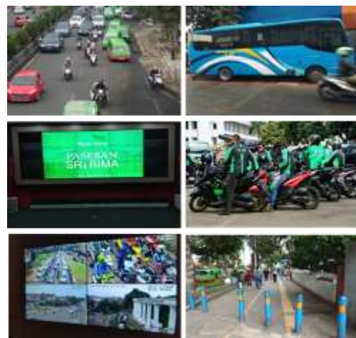
Gambar 1. Kondisi Dimensi Mobilitas

Kota Bogor memiliki 26 CCTV yang digunakan untuk memantau pergerakan lalu lintas dan keamanan di jalan. CCTV ini berada dibawah pengawasan Dinas Perhubungan Kota Bogor. Kota Bogor juga memiliki control room yang berada di Kantor Walikota Bogor. Dari sisi keselamatan, Kota Bogor belum memiliki akses cepat berbentuk aplikasi seperti di Kota Bandung maupun Kota Surabaya. Dalam kondisi darurat warga dapat menghubungi nomor telepon darurat (NTPD) 112.