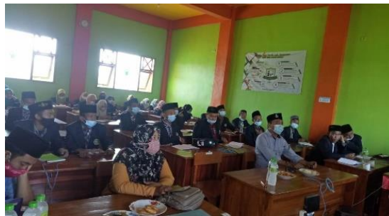
Gambar 1. Penyuluhan Penyusunan Perangkat Pembelajaran

Faktor pendukung dalam kegiatan pengabdian ini adanya fasilitas aula dan perlengkapannya yang memadai seperti LCD, layar, kipas angin dan mikrofon. Bahan materi (hard copy) telah disampaikan terlebih dahulu sehingga memudahkan para guru memahami apa yang disampaikan serta guru-guru sangat antusias mengikuti dan aktif dalam kegiatan tanya jawab.