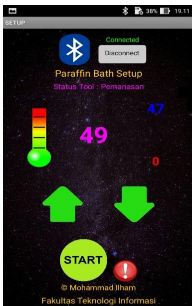
Gambar 6 Bluetooth Terhubung