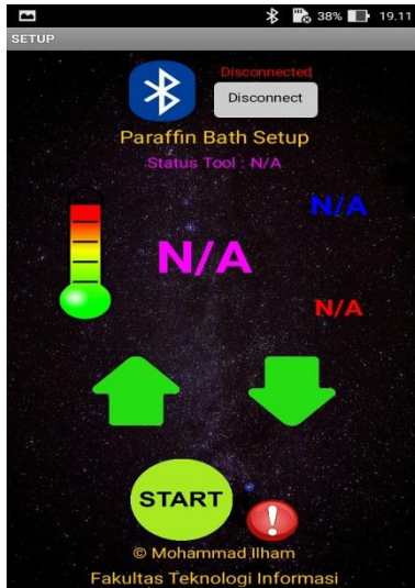
Gambar 5 Bluetooth Tidak Terhubung