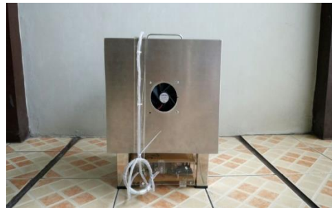
Gambar 2 Alat Tampak Depan

Pada perancangan modul alat Paraffin Bath ini yang dilengkapi dengan pemanas ( heater ), sensor Thermokopel type K, Modul MAX 6675, kipas, Infrared Proximity sensor Switch dan tampilan aplikasi android. Alat ini memiliki spesifikasi mekanik seperti pada tabel 1 serta foto alat pada gambar 2 tampak depan, gambar 3 tampak atas.