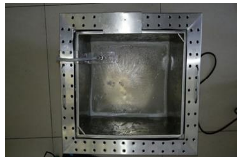
Gambar 3. Alat Tampak Atas