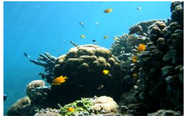
Gambar 4. Kelimpahan Ikan Chromis di Karang Paisutanga

Potensi yang ada di bawah laut seperti ikan, terumbu karang dan biota lainnya cukup bagus. Terutama terumbu karang secara umum keanekaragamannya masih baik, terutama daerah jauh dari daratan dan perkampungan, namun pada beberapa lokasi dijumpai terjadi kerusakan akibat aktifitas pemboman dan sianida.