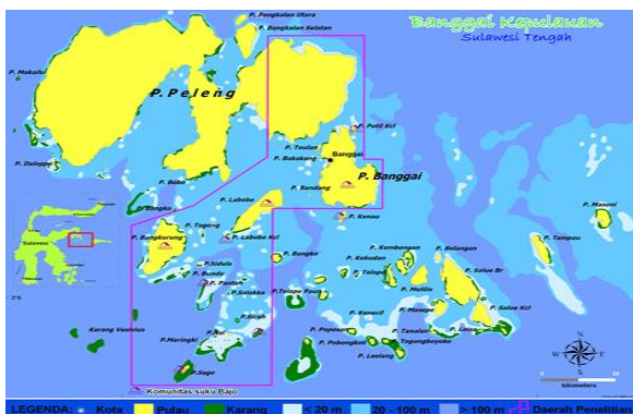
Gambar 1. Lokasi Pengamatan, di Kabupaten Banggai Kepulauan

Pengamatan dilakukan di Kabupaten Banggai Kepulauan dengan melakukan survey ke beberapa lokasi yang berpotensi sebagai objek wisata bahari dan melakukan wawancara dengan penduduk setempat.