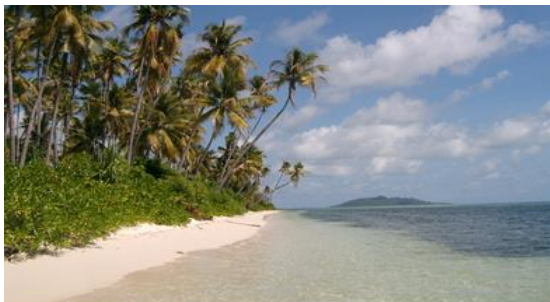
Gambar 2. Pantai berpasir pada sisi Barat Pulau Maringki

Klasifikasi pantai di Kabupaten Banggai Kepulauan secara garis besar dapat di bagi menjadi pantai berbeting, pantai berpasir, pantai mangrove. Keceragaman topografi atau kenampakan dan batuan penyusun memiliki ciri khas dan kenampakan sangat kontras. Pantai berbeting sangat dominan di Kabupaten Banggai kepulauan, khususnya pada pulau-pulau yang berukuran sedang, seperti Pulau Peleng, Pulau Banggai, Pulau Labobo, Pulau Bangkurung, Pulau Sago. Pantai berpasir dapat dijumpai di semua pulau yang terdapat di Banggai Kepulauan, mulai pulau yang berukuran sedang sampai pulau yang berukuran kecil dan gusung. Material pantai berasal dari lapukan batuan penyusun pulau tersebut dan hasil rombakan terumbu karang dengan kemiringan lereng yang landai – datar.