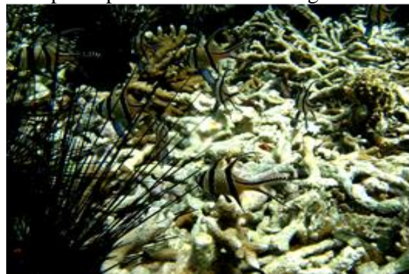
Gambar 5. Kelimpahan Cardinal Fish di perairan Pulau Bandang

Keanekaragaman ikan karang sangat melimpah, terutama ikan hias bisa di jumpai di hampir seluruh perairan, selain ikan hias, ikan konsumsi, seperti sunu/kerapu, kakap, ikan bawal sering dijumpai dalam bentuk scoolling (gerombolan), masih dijumpai beberapa spesies langka, seperti napoleon, cardinal fish, kerapu bebek, lobster yang terdapat di perairan Pulau Bandang