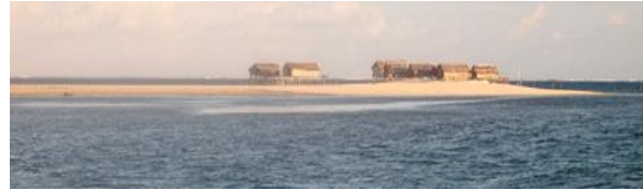
Gambar 3. Gusung yang terdapat sebelah Tenggara Pulau Nal

Pantai mangrove cukup luas sebarannya di Kab. Banggai Kepulauan dan hampir dijumpai pada semua pulau. Selain berfungsi sebagai pelindung terhadap erosi dan abrasi, pantai ini memiliki daya tarik tersendiri dan menambah keseragaman jenis pantai yang terdapat di Banggai Kepulauan