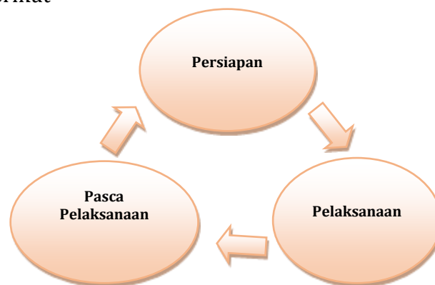
Gambar 1. Metode Pelaksanaan Pelatihan

Pelatihan PTK dilaksanakan di SD Gugus V dan VII Nagari Maek, Kecamatan Bukik Barisan, Lima Puluh Kota dengan jumlah peserta 56 orang. Pihak yang dalam kegiatan ini adalah Dosen dan Mahasiswa Universitas Negeri Padang yang berperan sebagai fasilitator. Selain itu pihak yang terlibat adalah guru SD Gugus V dan VI Nagari Maek, Kecamatan Bukik Barisan, Lima Puluh Kota sebagai peserta pelatihan. Metode pelaksanaan kegiatan ini dengan menggunakan metode seminar dan metode pelatihan dengan tahapan kegiatan yang dapat dilihat pada gambar berikut