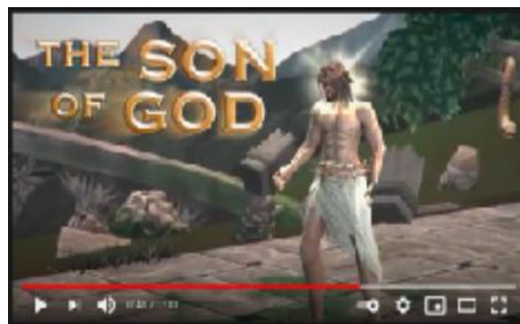
Gambar 4. Karakter Yesus diberi referensi sebagai Son of God .

pemahaman orang Romawi, Anak Allah ini merujuk kepada Raja Romawi (anak Allah). Di dalam dua konteks ini, Alkitab menggambarkan Yesus sebagai Anak Allah dapat dipahami sebagai yang ilahi (bukan sekadar manusia biasa), secara khusus melalui peristiwa kebangkitan dari orang mati.