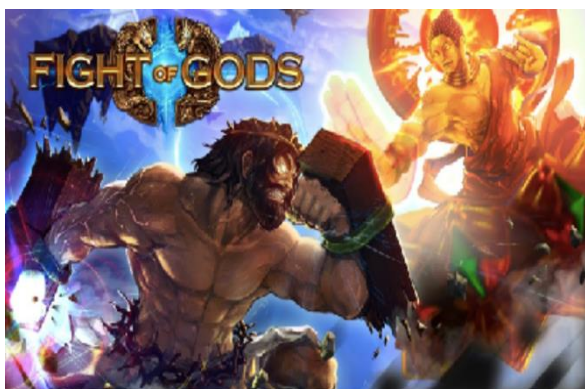
Gambar 1. Poster utama promosi video game Fight of Gods

Pertama kali dirilis pada September 2017 melalui Steam (Windows), FoG juga diproduksi di platform lain; Nintendo Switch (Januari 2019) dan PlayStation 4 (Juli 2020).