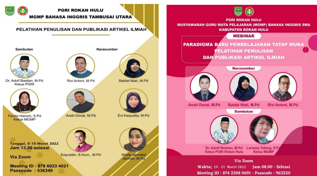
Gambar 1. Flyer Kegiatan