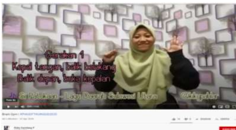
Gambar 3. Video Senam Otak yang dilakukan oleh mahasiswa calon guru RA FTK UIN SGD Bandung. Video dapat diakses pada halaman berikut ini

https://www.youtube.com/watch?v=v7EctsZUIfA