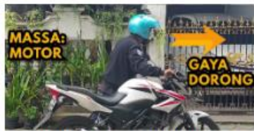
(b) motor didorong tanpa massa orang