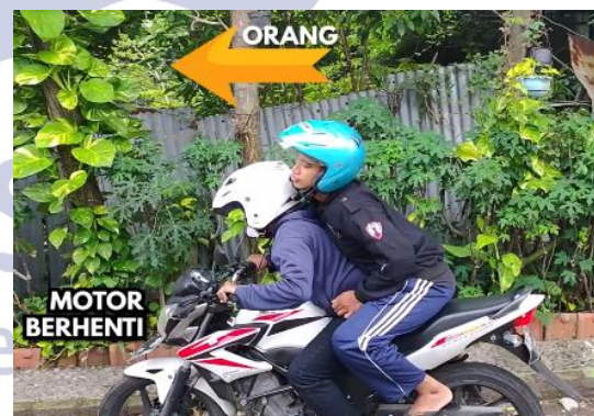
Gambar 2. Cuplikan video penerapan hukum 1 newton

Pengembangan media pembelajaran fisika berbasis adobe flash ipni didalamnya terdapat menu materi yang berisi materi hukum newton serta dilengkapi video penerapan pada kehidupan sehari-hari pada setiap hukum newton, berikut cuplikan gambar dari videonya: