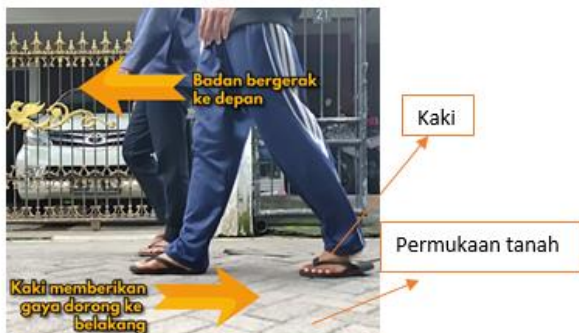
Gambar 4. Cuplikan video penerapan hukum 3 newton

Pada video penerapan hukum 2 newton ini membahas tentang mendorong motor, dimana saat kita mendorong motor tanpa massa orang di atasnya dengan gaya yang sama yang kita gunakan untuk mendorong motor yang terdapat massa orang di atasnya, akan didapatkan bahwa motor yang terdapat massa orang di atasnya akan bergerak lebih lambat daripada motor tanpa massa orang di atasnya.