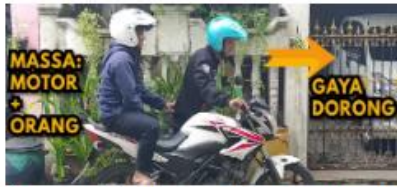
(a) motor didorong terdapat massa orang