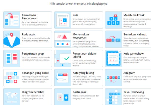
Gambar 1. Tampilan Menu aplikasi WordWall