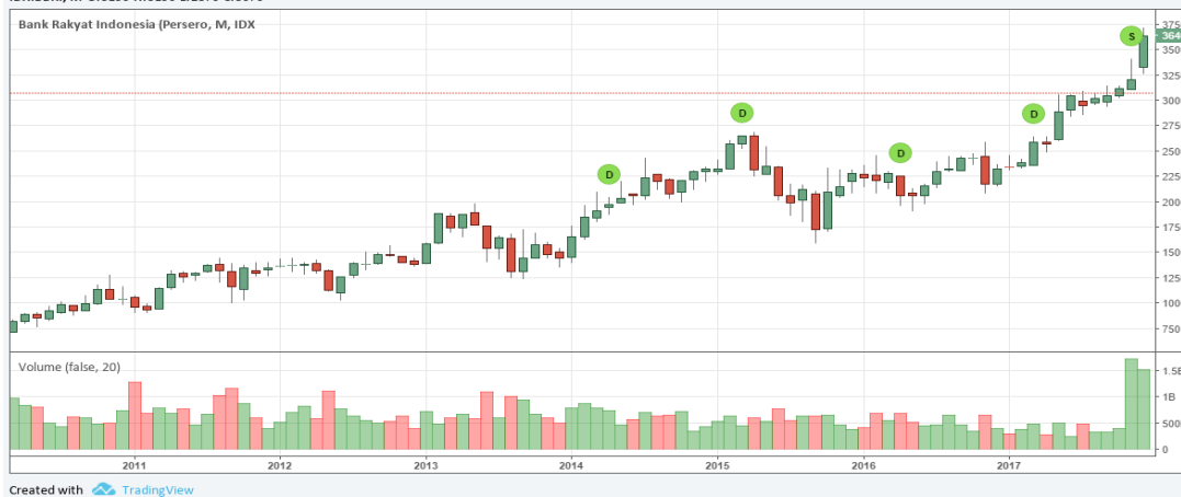
Gambar 1. Grafik Harga Saham

Published on TradingView.com, October 17, 2018 22:13 +07 IDX:BBRI, M O:3150 H:3190 L:2870 C:3070