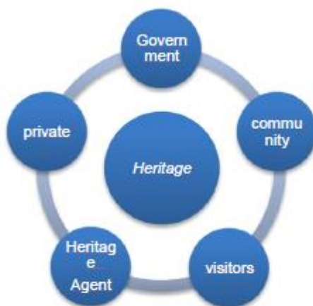
Gambar 4. Model Strategi Kolaboratif-Strategis

Kunci pertama dalam mengembangkan potensi wisata sejarah di Banda Naira adalah kolaborasi antara para pemangku kepentingan. Situs wisata sejarah di Banda memiliki potensi yang sangat menarik bagi wisatawan, namun belum dikembangkan karena komunikasi antar pemangku kepentingan yang terbatas. Semua pemangku kepentingan membutuhkan kesadaran bersama bahwa mengembangkan destinasi wisata di Banda membutuhkan kolaborasi. Setiap pemangku kepentingan memiliki peran dalam pengembangan wisata cagar budaya di Banda. Peran adalah aspek dinamis dari suatu posisi atau status. Jika seseorang menjalankan hak dan kewajibannya sesuai dengan posisi atau status itu, maka orang tersebut telah menjalankan peran tersebut (Suharto 2006).