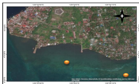
Gambar 1 Peta Kota Naira

Kecamatan Banda terdiri dari 12 pulau, dengan 7 pulau dihuni dan 5 pulau tidak dihuni. Pada Tahun 2015, Kecamatan Banda telah memiliki 18 Desa. Kecamatan Banda secara geografis terletak pada posisi : 5°43' - 6°31' Lintang Selatan dan 129°44' - 130°04' Bujur Timur dan dibatasi oleh: Selat Seram disebelah Utara, Kepulauan Teon Nila Serua disebelah Selatan, Laut Banda disebelah Timur, dan Laut Banda disebelah Barat ( Banda Dalam Angka , 2016:4)