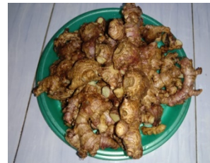
Gambar 1. Jahe merah segar (Dokumen pribadi, 2021)

terbuka seperti kebun dan pekarangan. Tanaman ini juga dapat tumbuh di tanah padat, kering ataupun gembur (Heinrich dan Subroto, 2000).