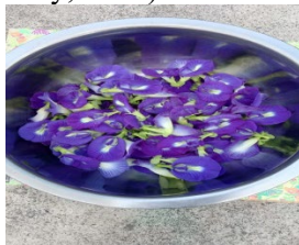
Gambar 2. Bunga telang segar

Bunga telang juga merupakan salah satu tanaman yang dapat digunakan sebagai obat. Bunga telang diperoleh dari pohon telang yang memiliki nama latin Clitoria Ternatea L. Tanaman ini banyak dijumpai di pekarangan rumah penduduk. Biasanya digunakan sebagai tanaman hias saja dan bukan sebagai tanaman obat. Bunga dari tanaman ini sangat indah berwarna biru terang, putih, pink dan ungu. Zat warna yang terkandung dalam bunga ini dapat dimanfaatkan sebagai pewarna makanan, kue serta sebagai bahan dasar pembuatan minuman (Purwandhani et al. , 2019). Selain dimanfaatkan zat warnanya, bunga telang juga diyakini memiliki banyak manfaat bagi tubuh. Bunga telang segar maupun yang telah dikeringkan dapat diseduh dijadikan minuman herbal. Seduhan bunga telang memiliki aroma khas wangi bunga telang dan warna yang menarik (Jeremy, 2019).