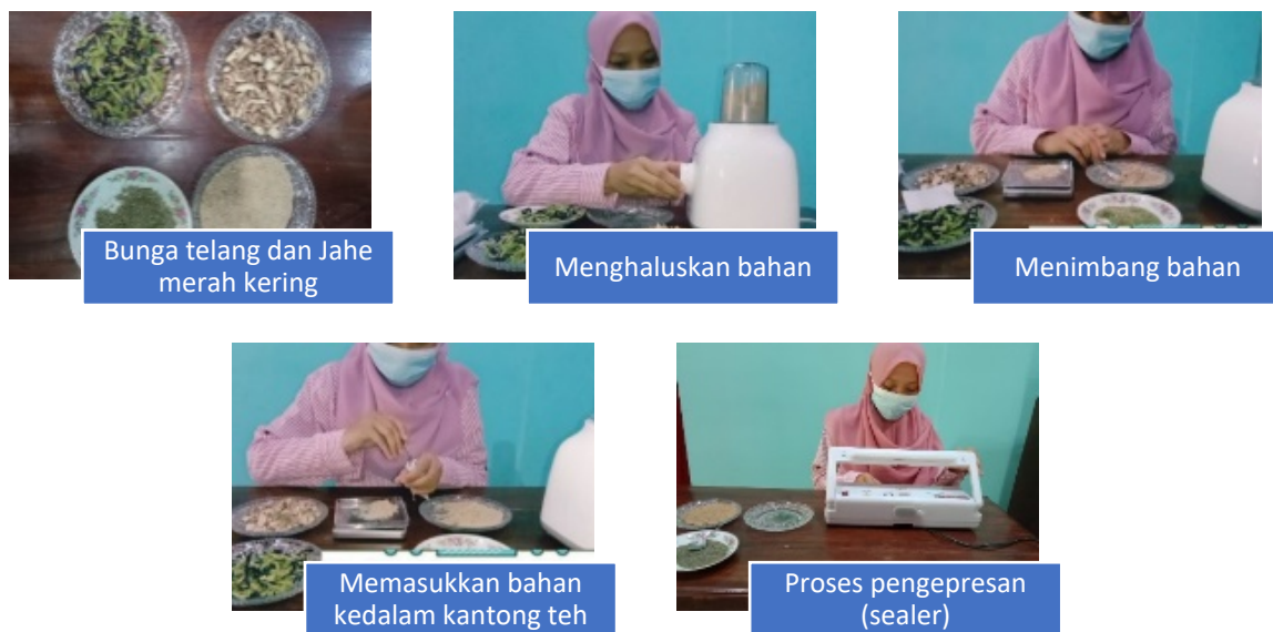
Gambar 3. Tahapan pembuatan teh (Dokumen pribadi, 2021)

terkumpul selanjutnya dilakukan sortasi yang tujuannya adalah dari tanah, krikil, rumput-rumputan, bahan tanaman lain, atau bagian lain dari tanaman yang tidak digunakan dan bagian tanaman yang rusak (dimakan ulat dan sebagainya). Selanjutnya dilakukan pencucian bahan dibawah air mengalir sehingga kotoran, debu yang menempel dapat larut bersama air. Setelah bersih jahe merah dirajang secara melintang dengan ketebalan kurang lebih 0,5cm dan dijemur dibawah sinar matahari dengan ditutup kain merah. Bunga telang juga dijemur dibawah sinar matahari dengan ditutup kain hitam. Pengeringan dengan ditutup kain hitam ini bertujuan untuk mencegah kerusakan senyawa aktif yang terkandung. Dan tujuan dari pengeringan ini juga bertujuan agar daya simpannya menjadi lebih lama. Bahan-bahan yang sudah dikeringkan selanjutnya dihaluskan dan kemudian dibuat menjadi berbagai formulasi.