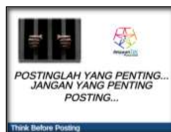
Gambar 1. Slide power point materi sosialisasi internet sehat penguatan Think Before Posting

Berdasarkan hasil wawancara tersebut menunjukkan bahwa relawan TIK Pasuruan memberikan edukasi pada pelajar agar lebih berhati-hati dalam menyampaikan informasi di dunia digital khususnya melalui media sosial. Relawan TIK Pasuruan memberikan penguatan pada pelajar untuk selalu terapkan Think Before Posting . Pernyataan tersebut juga didukung dengan materi slide power point yang disampaikan oleh relawan TIK Pasuruan pada pelajar untuk lebih berhati-hati dalam menyampaikan informasi di media sosial dengan menerapkan think berfore posting .