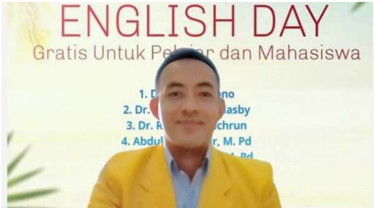
Gambar 1. Foto narasumber

Berikut dokumentasi kegiatan pengabdian kepada masyarakat: