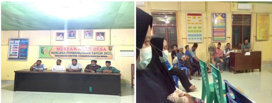
Gambar 1. Penyampaian Program Pengabdian Kepada Masyarakat Desa Banjar Guntung