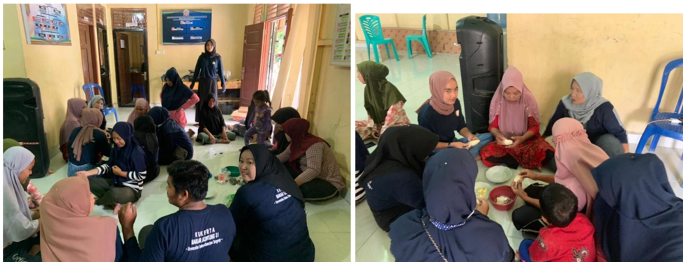
Gambar 6. PKM bidang usaha mikro dengan sosialisasi produsen dan pelatihan membuat makanan tradisional

Dalam bidang produksi usaha mikro diharapkan dapat berjalan semaksimal mungkin, sehingga kegiatan ini diharapkan bisa menjadi pelopor kebangkitan ekonomi masyarakat yang ada di Desa Banjar Guntung. Hal ini tentunya diharapkan kerja sama antar sesama masyarakat sebagai produsen utama dan pemerintah aparat desa sebagai bidang pemasaran, sehingga dengan koordinasi yang dilakukan ini dapat menjadi suatu usaha yang bisa menggerakkan roda perekonomian dan nama desa khususnya.