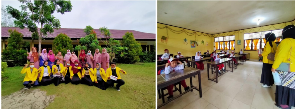
Gambar 5. PKM bidang kesehatan dengan sosialisasi dan pembagian Masker Kesehatan

Setelah diberlakukannya pengabdian ini tentu tim pengabdian juga mengharapkan agar seluruh lapisan masyarakat tidak menganggap sepele masalah kesehatan sehingga dapat menanggapi serius tentang pentingnya menjaga kesehatan pribadi dan orang lain sekitar.