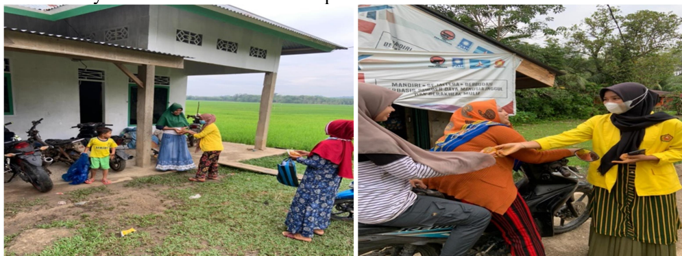
Gambar 4. PKM bidang kesehatan dengan sosialisasi dan pembagian Jamu Kesehatan

Dalam bidang kesehatan diharapkan masyarakat yang merupakan target utama pengabdian dapat senantiasa menjadi agen pelopor kesehatan, bukan hanya mau menerapkan perilaku hidup sehat dengan pencegahan dan perawatan tetapi juga dapat membawa masyarakat-masyarakat lainnya untuk melakukan hal serupa.