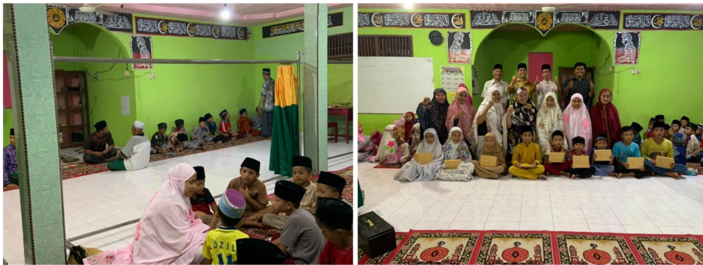
Gambar 2. Pelaksanaan PKM bidang Keagamaan Di Desa Banjar Guntung

Dalam hal ini diharapkan juga dapat meningkatnya hasil yang dilakukan oleh tim pengabdian terhadap keberlangsungan program keagamaan yang ada di Desa Banjar Guntung. Yang dari awalnya tidak terlalu dominan pergerakannya menjadi membaik dan semakin meningkat minat keagamaan anak-anak di desa tersebut.