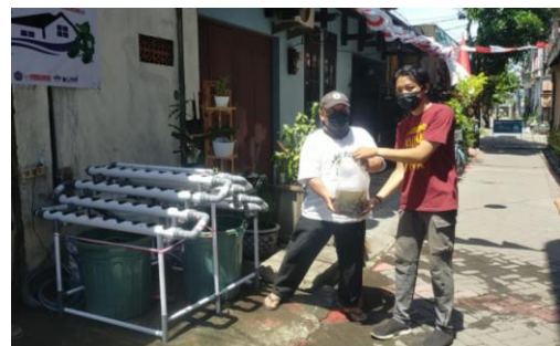
Gambar 5: Penyerahan benih lele dan benih tanaman hidroponik pada masyarakat mitra