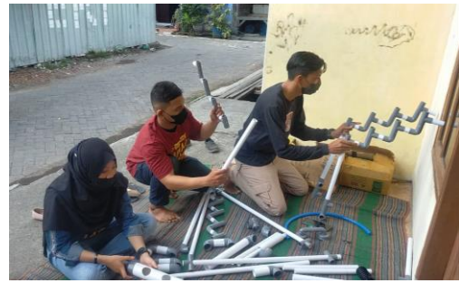
Gambar 3: Proses pembuatan TTG

Sehingga penerapan budidaya ikan lele sistem bioflok yang diintegrasikan dengan tanaman sayuran hidroponik menghasilkan ikan lele yang berkualitas karena pakan ikan lele yang telah disesuaikan dengan kebutuhan dan sayur yang sehat hal tersebut karena nutrisi tanaman yang diberikan ke tanaman tidak menggunakan bahan kimia atau pestisida.