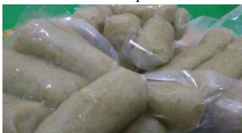
Gambar 8: hasil produk olahan dari lele dan tanaman hidroponik