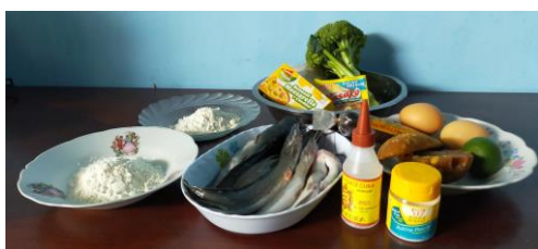
Gambar 6: bahan yang diperlukan untuk pengolahan produk berbahan dasar lele dan tanaman hidroponik