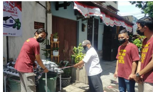
Gambar 4: Peresmian TTG oleh masyarakat mitra