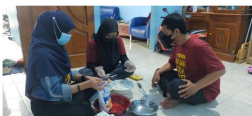
Gambar 7: Proses pengolahan produk berbahan dasar lele dan tanaman hidroponik