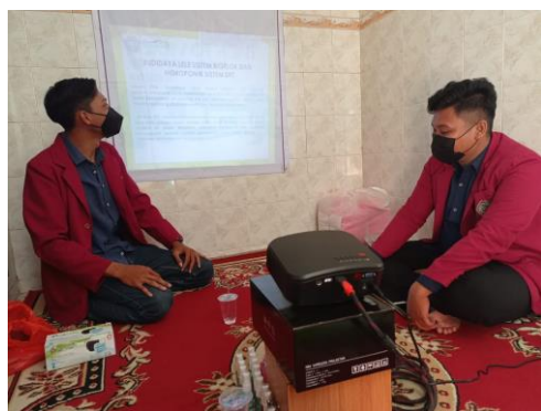
Gambar 2: Kegiatan sosialisasi TTG pada masyarakat mitra

Kegiatan sosialisasi TTG di lakukan secara offline dengan menerapkan protokol kesehatan. Kegiatan ini disambut antusias oleh masyarakat sasaran pengabdian, dalam kegiatan ini di jelaskan rancangan TTG berupa Budidaya Lele Sistem Bioflok dan Budidaya Tanaman Hidroponik Sistem Deep Flow Technique dalam satu rangkaian, serta cara pengoprasian dari TTG tersebut.