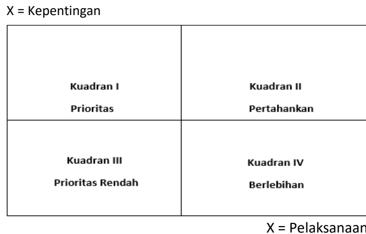
Gambar 1 Pembagian Kuadran Dalam IPA

kinerja yang dijabarkan kedalam sebuah grafik dua dimensi yang memudahkan untuk penjelasan data dan usulan praktisnya. Grafik dua dimensi tersebut dapat dilihat dalam Gambar ( 1 ).