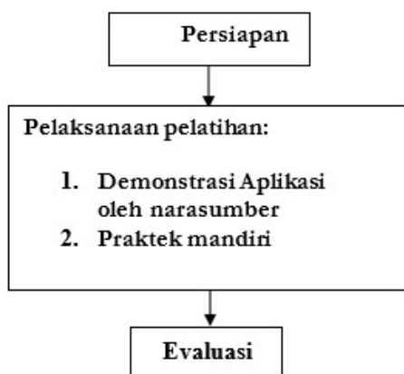
Gambar 1. Bagan alur kegiatan

Untuk mengukur keberhasilan pelatihan dilakukan dengan mengevaluasi sejauh mana peserta dapat memahami aplikasi PMW berbasis Web, dan mengukur sejauh mana peserta dapat mengoperasikan aplikasi PMW berbasis Web. Bagan alur kegiatan PKM disajikan dalam Gambar 1.