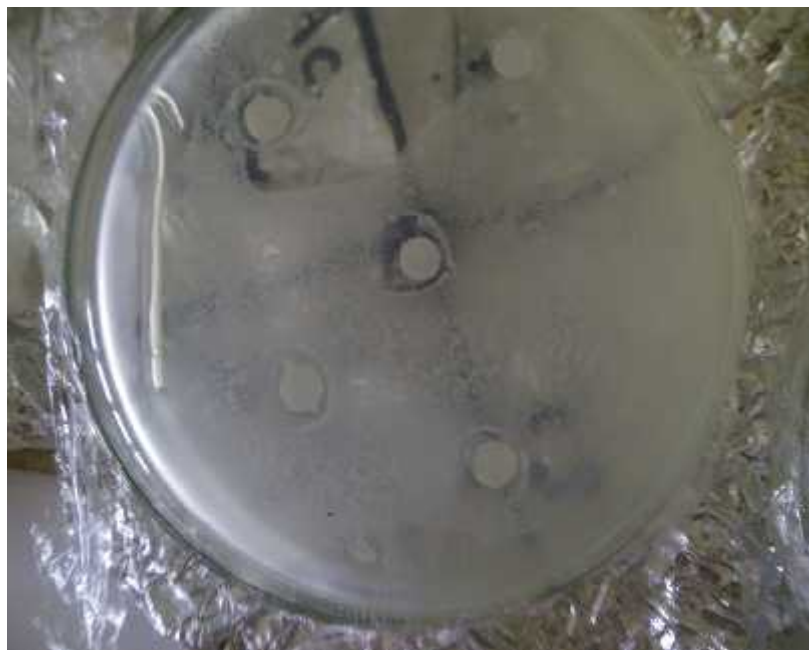
Gambar 1. Cawan petri yang berisi kertas cakram yang mempunyai konsentrasi 20, 40, 60%, kontrol Positif dan kontrol negatif.