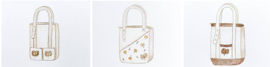
Gambar 1. Sketsa 3 Alternatif Terpilih

Alternatif desain terpilih berupa 3 sketsa rancangan tas totebag yang telah melewati berbagai pembobotan dari berbagai sumber yang berpengalaman dalam desain produk dan fashion. Desain final yang terpilih merupakan alternatif 4 dengan penambahan bahan kulit sintetis dan