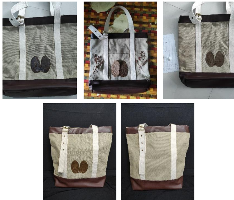
Gambar 4. Hasil Akhir