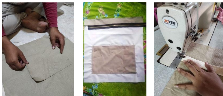
Gambar 3. Proses Menjahit