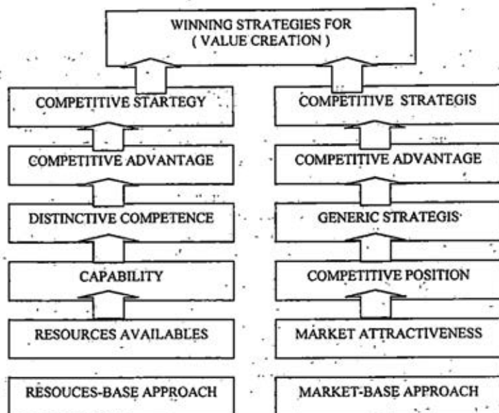
GAMBAR 1 DASAR DAN ARAH MODEL RESOUCE-BASE DAN MODEL MARKET-BASE.