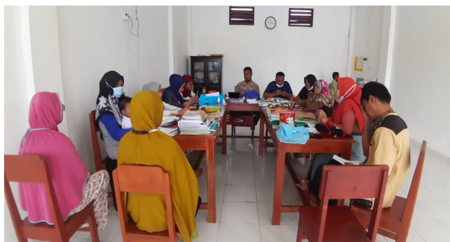
Gambar 1. Rapat Pembentukan TIM PPDB

yang mau bersekolah di MTs Yaa Bunayya. jadwal penerimaan peserta didik baru selama 1 minggu pada awal bulan Juni sehingga dengan serangkaian pelaksanaan penerimaan peserta didik baru ini dapat selesai diakhir bulan Juni agar awal bulan juli proses pembelajaran sudah dapat berjalan efektif (Atina Rahmah 2021). Perencanaan terkait dengan bagaimana prosedur pendaftaran yang akan dilaksanakan juga telah di tetapkan. Hal ini dilakukan dengan tujuan agar dalam teknis pelaksanaan dapat berjalan dengan lancar sesuai dengan apa yang telah disepakati.