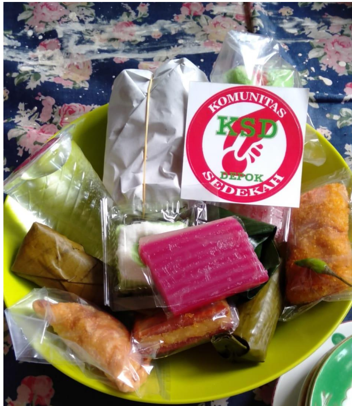
Gambar 4. Isi Menu Sedekah Sarapan KSD GDC Kalimulya

Setelah seluruh daftar menu sudah terkumpul, selanjutnya para sukarelawan KSD GDC – Kalimulya membungkus paket sarapan secara bergotong royong dan hari itu (Jumat, 10 Juli, 2020) Hafizah Rifiyanti dan Dyah Utami Dewi, dosen IBI Kosgoro 1957 berkesempatan membantu aksi kemanusiaan tersebut (gambar 2 & 3). Hari itu menu yang terkumpul dan dapat dimasukkan ke dalam masing-masing kantong berisi nasi bungkus (nasi beserta lauk pauhnya), air mineral dan beberapa snack . Paket sarapan yang terkumpul hari itu sebanyak 100 paket nasi bungkus, 75 paket snack masjid (gambar 4). Proses pembungkusan paket snack dilakukan dari jam 6 pagi hingga selesai jam 7 pagi.