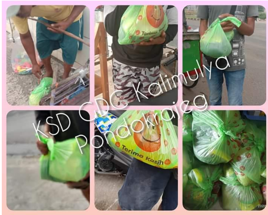
Gambar 6. Penerima Sarapan KSD GDC – Kalimulya

Sebanyak 100 paket sarapan nasi bungkus dan 75 paket snack masjid sudah selesai dibungkus dan siap disebar oleh tim relawan KSD GDC – Kalimulya. Target penerima hari itu adalah para pemulung, pengendara ojek pangkalan, petugas kebersihan dan beberapa kaum duafa lainnya yang membutuhkan. Tim sukarelawan KSD GDC – Kalimulya yang menyebar hari itu terdiri dari 4 tim, dengan masing-masing membawa 25 paket nasi bungkus dengan mayoritas tim relawan yang bergerak hari itu adalah kaum akhwat (ibu – ibu relawan KSD GDC).