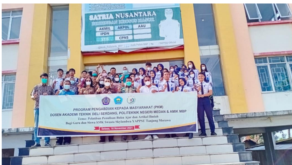
Gambar 2. Foto bersama dengan Kepala Sekolah, Guru dan Siswa