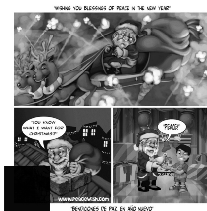
Gambar 8. E-card Natal tentang Tindakan

Teks 'Selamat Natal dan Tahun Baru', ikon dari hari besar umat Kristiani yang merupakan konotasi dari awal perjalanan Yesus. Dimana Natal adalah hari raya umat Kristiani untuk memperingati hari kelahiran Yesus Kristus. Dari penjabaran di atas, e-card Natal dalam aspek ruang tersebut diwakilkan oleh tanda gedung gereja, dimana di gedung gerejalah firman-firman dari Tuhan digaungkan. Dengan menggunakan tanda-tanda dari aspek alam awan dan langit menjadi tanda kehadiran dan kemuliaan Tuhan. Dan dalam aspek waktu teks Selamat Natal dan Tahun Baru menjadi wakil dari tanda