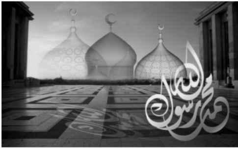
Gambar 15. E-card Idul Fitri tentang Figur

dihapus), sesuai dengan manfaatnya. Ini tak dapat dilakukan sekiranya Al Qur'an diturunkan sekaligus. Ketiga turunnya suatu ayat sesuai dengan peristiwa-peristiwa yang terjadi akan lebih mengesankan dan lebih berpengaruh di hati. Keempat akan memudahkan penghafalan, dan kelima di antara ayat-ayat ada yang merupakan jawaban daripada pertanyaan atau penolakan suatu pendapat atau perbuatan, hal tersebut tidak akan terlaksana kalau Al Qur'an diturunkan sekaligus (Al Qur'an dan Terjemahannya, 1971: 16).