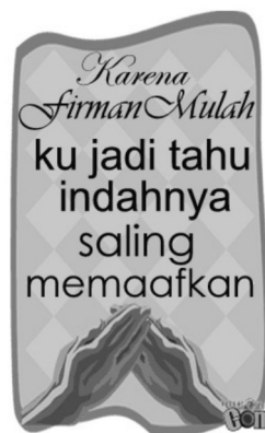
Gambar 13. E-card Idul Fitri tentang Tindakan

Warna hijau muda yang mendominasi warna latar belakang bentuk ketupat adalah denotasi dari Indeks warna ketupat, yang dikonotasikan sebagai surga dan kebahagiaan abadi. Dalam kode budaya dikatakan bahwa warna yang melambangkan surga dan kebahagiaan abadi (Schimmel, 1996: 53-54). Sedangkan warna putih pada latar