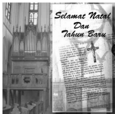
Gambar 9. E-card Natal tentang Firman

Lembar firman dalam Alkitab pada e-card tersebut merupakan denotasi dari ikon selembarnya ayat dalam kitab yang