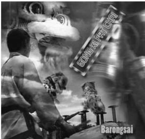
Gambar 3. E-card Imlek tentang Aspek Tindakan

Sehingga secara keseluruhan kelenteng merupakan suatu tempat untuk memuja dewata karena Ia hadir disana dan sebagai bentuk penghormatan terhadap dewa-dewi sebagai sang penguasa jagad raya yang merupakan tempat berlindungnya