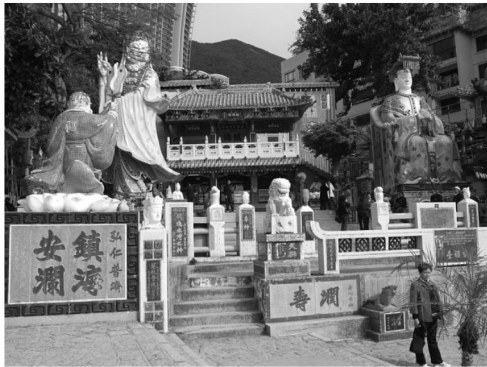
Gambar 2. E-card Imlek tentang Aspek Ruang

tersebut adalah warna yang digunakan oleh orang-orang suci kepercayaan dan agama masyarakat Cina ataupun digunakan oleh seorang kaisar dari negeri Cina.