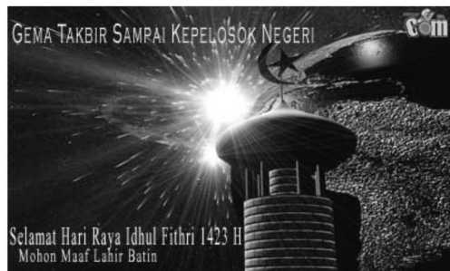
Gambar 11. E-card Idul Fitri tentang Alam

Teks 'Gema Takbir Sampai Kepelosok Negeri dan Selamat Hari Raya Idul Fithri 1423 H Mohon Maaf Lahir dan Batin' adalah ikon dari hari besar agama Islam dimana dikumandangkannya gema takbir, sehingga dikonotasikan sebagai bentuk keagungan