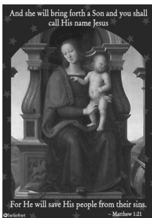
Gambar 10. E-card Natal tentang Figur

Sehingga secara keseluruhan dalam e-card Natal tentang firman, menggunakan tanda visual firman dalam lembaran