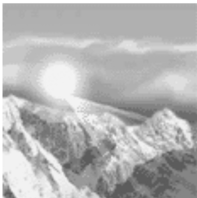
Gambar 1. E-card Imlek tentang Aspek Alam

adanya gunung lain yang tak terlihat dan lebih tinggi sehingga menutupi cahaya pada bagian tengah kedua gunung. Dalam e-card tersebut pada makna tingkat pertama langit didenotasikan sebagai tempat yang tertinggi dan tidak terjangkau oleh manusia, dan langit dikonotasikan sebagai keagungan. Dengan makna tingkat kedua bahwa langit dalam budaya Cina memiliki arti yang paling tinggi dimana merupakan tempat para Dewa bersemayam seperti yang dikatakan bahwa Dewata penguasa alam semesta yang mempunyai wilayah kekuasaan di langit (Hasyim, 2002).