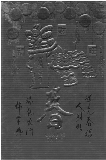
Gambar 4. E-card Imlek tentang Ucapan.

barongsai yang sedang menari tersebut sekaligus menjadi indeks barongsai singa selatan, karena memiliki ciri kaki yang lebih sedikit, cara penempatan barongsai yang saling berhadapan pada tiang-tiang penyangga, mengindekskan akan adanya suatu atraksi diantara keduanya. Barongsai dalam kode budaya Cina merupakan konotasi dari kebahagiaan dimana tarian barongsai adalah suatu tarian dengan menggunakan tampilan singa yang dianggap sebagai lambang kebahagiaan dan kesenangan, sehingga tarian singa ini dipercaya membawa keberuntungan yang sering dipentaskan diberbagai acara dan ritual yang penting bagi masyarakat Cina. Penempatan dua barongsai pada pilar-pilar tinggi mengkonotasikan keberanian dalam bertarung dan keberhasilan mencapai tujuan yang diinginkan.