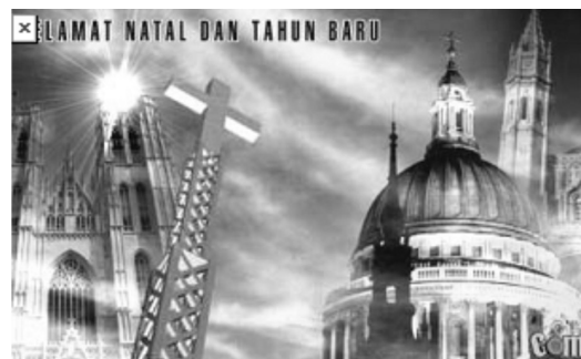
Gambar 7. e-card Natal tentang Ruang

Gedung gereja (gambar 7) adalah denotasi dari ikon bangunan, tempat beribadat umat Kristiani, sebagai konotasi dari kehadiran Tuhan. Gedung gereja dalam kode budaya terangkum dalam Alkitab bahwa, “Dan biarlah kamu juga dipergunakan sebagai batu hidup untuk pembangunan suatu rumah rohani bagi suatu imamat kudus, untuk mempersembahkan persembahan-persembahan rohani yang karena Yesus Kristus berkenan kepada Allah” (Alkitab Petrus 2: 5).