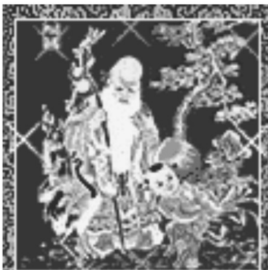
Gambar 5. E-card Imlek tentang Figur

Dalam e-card Imlek (gambar 5) figur ini memiliki tanda visual, yaitu ikon Konghucu dengan benjolan besar pada dahinya, seorang anak laki-laki, burung bangau, pohon dan tanaman serta sinar-sinar yang berkilauan. Dengan menggunakan dominasi warna merah dan kuning keemasan. Konghucu dengan benjolan besar di dahinya merupakan denotasi dari ikon orang suci