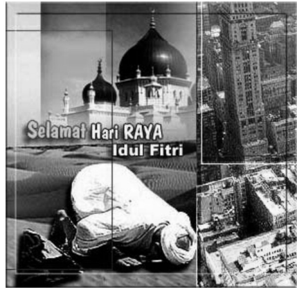
Gambar 12. E-card Idul Fitri tentang Ruang dan Waktu.

Keseluruhan gambar tersebut memberi makna bahwa tanda-tanda yang terdapat