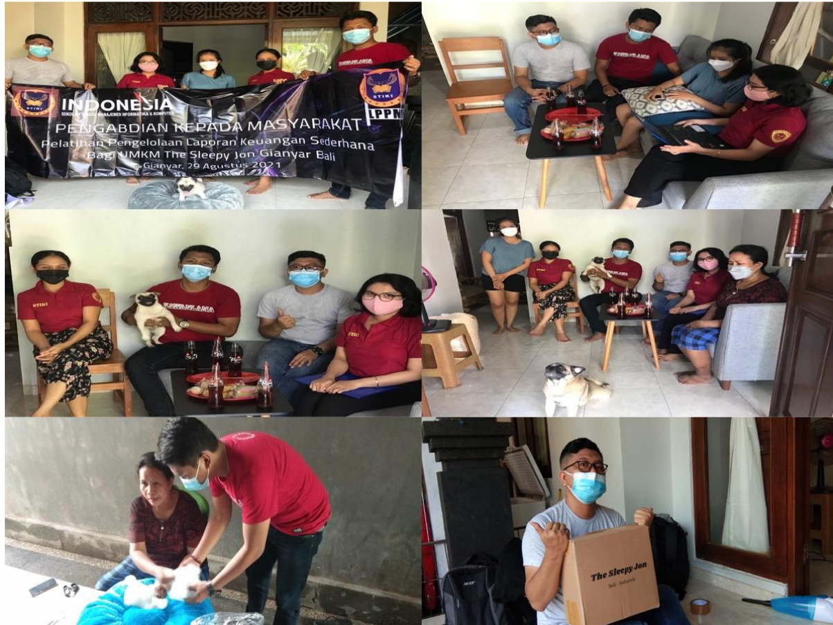
Gambar 2: Kegiatan Sosialisasi dan Pelatihan Laporan Keuangan Sederhana pada UMKM The Sleepy Jon Ketika Kegiatan Pelatihan dan Produksi

oleh 6 orang pegawai dari UMKM The Sleepy Jon. Berikut merupakan beberapa dokumentasi kegiatan pada sosialisasi dan pelatihan laporan keuangan sederhana yang dilaksanakan bersama dengan Mitra.