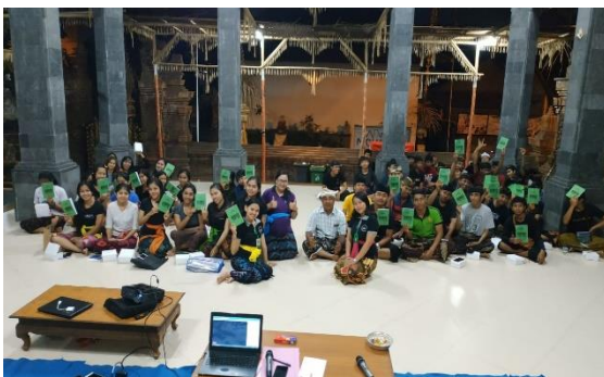
Gambar 1. Foto bersama peserta kader remaja dan Kelian Dinas saat kegiatan PERISAI DIRI

Setelah dilaksanakan kegiatan PERISAI DIRI (Pelatihan Kelompok Remaja Hindari Sex Bebas Dan Pernikahan Dini), dalam kegiatan tersebut tim pelaksana pengabdian kepada masyarakat memberikan pelatihan pada kader remaja berupa kesehatan reproduksi, memberikan brainstorming dengan menayangkan video dan peserta diberi kesempatan menelaah dan mendiskusikan video tersebut, menjelaskan konsep reproduksi dan pernikahan dini, menjelaskan penyakit infeksi menular seksual, melakukan evaluasi proses kegiatan dengan melakukan pre-test dan post-test selama pelatihan di awal sesi dan dakhir sesi.