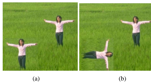
Gambar 1. Citra (a) wilayah terduplikasi (b) rotasi wilayah terduplikasi.

Ketujuh metode tersebut menggunakan fitur spesial untuk mencocokkan dua buah blok region . Metode tersebut terbukti robust terhadap operasi post-processing . Namun teknik yang ada memiliki keterbatasan, ketika salinan wilayah dirotasi maka pencocokan blok akan gagal. Terlihat pada gambar 1.(b) blok duplikat dapat tidak terdeteksi karena kegagalan metode tradisional.