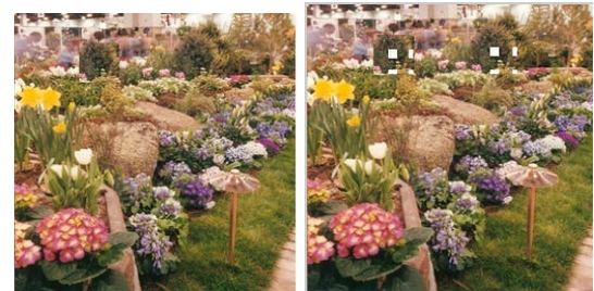
(d) Skala 0.9