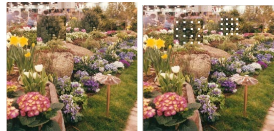
(e) Skala 1.4