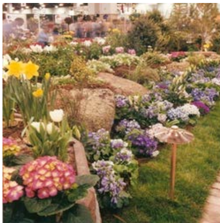
(a) Citra asli

Penggunaan DWT2 dapat mempercepat waktu proses sekitar 0.6 sampai 1.1 detik, namun masih memiliki keterbatasan tidak semua serangan citra duplicated region dapat dideteksi. Hal ini disebabkan karena, DWT level 2 mereduksi ukuran citra menjadi lebih kecil, sehingga blok tidak dapat menangkap fiturnya. Untuk operasi skala pada duplicated region , nilai matching tertinggi pada nilai 0.9 dan 1.1. Deteksi duplikasi rotasi tertinggi adalah 270 derajat. Untuk deteksi duplicated region di keseluruhan citra Gaussian blur bagus untuk semua level, sedangkan untuk Gaussian blur pada blok duplikasi saja sangat baik untuk blur 0.1 hingga 0.3.