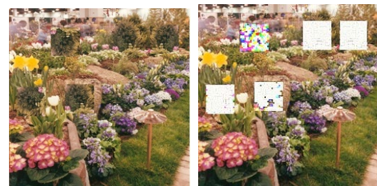
(g) Banyak blok terduplikasi dengan serangan translasi, pencerminan, dan rotasi.