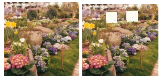
(f) Blur all 5