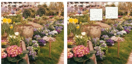
(b) Citra palsu duplicated region