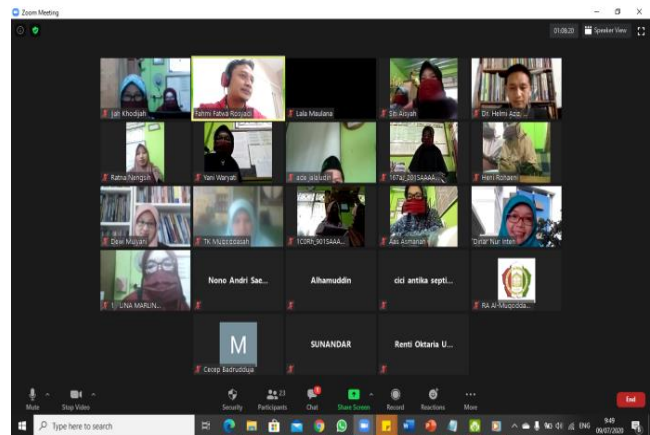
Gambar 2. Kegiatan Pemberdayaan

Berdasarkan paparan di atas, maka keberhasilan dalam pemberdayaan ini didukung oleh beberapa hal, di antaranya: pertama , Tim PKM dan mahasiswa sebelum tahap perencanaan telah melakukan pemetaan social. Pemetaan social dilakukan dengan cara mengunjungi lokasi sasaran dengan fokus utama pada lembaga pendidikan Islam yaitu madrasah. Hasil dari pemetaan social ini tim PKM mendapatkan peta konsep kegiatan pemberdayaan yang akan dilakukan untuk masyarakat dampingan. Kedua , kegiatan PKM yang menjadi acuan pelaksanaan program PKM pada saat perkenalan dengan stakeholder telah disertai dengan penjelasan maksud dan tujuan program secara jelas tentang kegiatan yang akan dilakukan, sehingga masyarakat dampingan memahami hal tersebut dengan baik. Ketiga , Tim PKM dalam pemetaan sosial tidak berhenti dengan dialog dan observasi, akan tetapi juga melakukan telaah dokumentasi untuk memperoleh data atau informasi yang valid mengenai kondisi masyarakat dampingan saat ini. Keempat , penentuan focus program PKM sangat memperhatikan hasil pemetaan sosial yang dilakukan oleh tim pengabdian. Dalam menentukan focus program tim pun mewawancarai dan menganalisis kebutuhan para guru madrasah, diantara hasilnya adalah kebutuhan mereka akan metode serta strategi pembelajaran yang dapat digunakan oleh guru-guru di madrasah utamanya dalam mengajarkan pembelajaran agama, menurut (Ulpah, n.d.), guru-guru madrasah membutuhkan