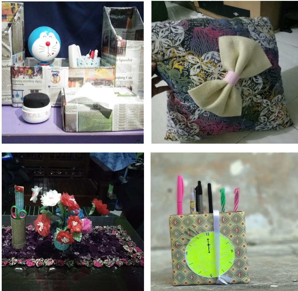
Gambar 3. Jenis-Jenis Kerajinan Tangan dari Sampah

Pedaaurulungan sampah plastik dalam bentuk kerajinan tangan merupakan cara yang paling sederhana dan mudah dilakukan. Sampah organik umumnya mudah didaurulang dalam bentuk kompos, sementara sampah non-organik seperti plastik, dan botol cukup sulit pendaaurulungannya karena beberapa daerah belum memiliki peralatan pendaaurulungan sampah non-organik. Kerajinan tangan merupakan salah satu cara pendaaurulungan sampah non-organik. Fatoni et al., (2017) sampah non-organik yang didaurulang menjadi kerajinan tangan dapat dikelompokkan menjadi 2 jenis, yaitu kerajinan sebagai benda pakai dan benda hias.