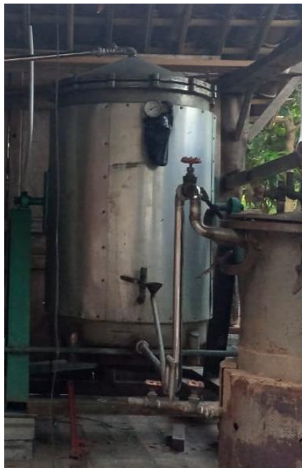
Gambar 5. Boiler terpisah dengan tungku reaktor.

Adapun kapasitas material daun sereh wangi yang dapat di olah dengan tungku ini adalah 100 kg, hal ini kita samakan dengan tungku penyulingan yang telah ada di Desa Guli Kecamatan Nogosari Boyolali, sehingga hasilnya nanti dapat dibandingkan. Pada gambar 4 tersebut terlihat ditambahkannya sistem pendinginan yang terhubung langsung dengan tungku reaktor, pada prinsipnya dapat dikatakan sama dengan sistem kukus, namun disini proses pendinginan untuk kondensasi langsung dilakukan ketika uap dari tungku reaktor keluar. Tungku sistem kohobasi ini juga tidak menempatkan boiler penghasil uap dibawah tungku reaktor, melainkan di tempatkan terpisah dengan tungku reaktor, seperti terlihat pada gambar 5. di bawah ini.