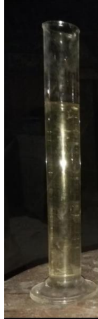
Gambar 9 Gelas ukur berisi minyak sereh wangi

Proses penyulingan dilakukan selama 4 sampai 5 jam dengan material daun sereh wangi menghasilkan minyak sereh wangi. Minyak hasil penyulingan dapat dilihat pada gambar 9. berikut :