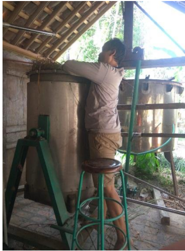
Gambar 1 Proses Penyulingan kukus (sederhana)

Proses penyulingan selama ini dilakukan dengan menggunakan peralatan sederhana dengan sistem kukus. Proses tersebut dilakukan dengan memanaskan sejumlah air dan menempatkan bahan tanaman atsiri di atas tungku (satu tungku boiler dan reaktor), kemudian hasil pemanasan akan menghasilkan uap dan uap tersebut dialirkan melalui pipa menuju ke bak pendingin. Proses tersebut membutuhkan waktu yang lama dan bahan bakar relatif banyak untuk memanaskan sejumlah air untuk menjadi uap. Tujuan penggunaan peralatan dengan sistem kukus ini adalah untuk menghasilkan uap air dalam jumlah yang banyak dari air yang relatif banyak. Proses tersebut dirasakan tidak sebanding dengan produk minyak sereh yang dihasilkan, karena tidak sebanding dengan biaya bahan bakar yang telah dikeluarkan.