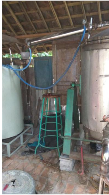
Gambar 4 Tungku Penyulingan sistem kohobasi