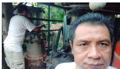
Gambar 8. Pengisian air pada boiler dan penyalaan tungku.

Pada penelitian ini proses pemasukan material daun sereh wangi masih menggunakan cara manual dengan tenaga manusia, hal ini dilakukan untuk menyamakan proses pemasukan material daun sereh wangi pada tungku sistem kukus yang telah ada. Proses selanjutnya adalah melakukan penutupan tungku reaktor dan menghidupkan boiler penghasil uap yang telah diisi air sebelumnya.