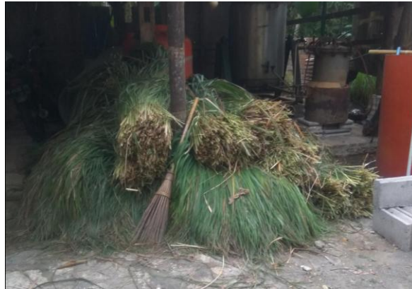
Gambar 6. Material daun sereh wangi yang akan diolah

Proses penyulingan minyak sereh wangi dengan tungku kohobasi, Langkah awal yang dilakukan adalah dengan mempersiapkan material, berupa daun sereh wangi yang diambil dari ladang. Gambar 6. adalah material yang akan diolah berupa daun sereh wangi.