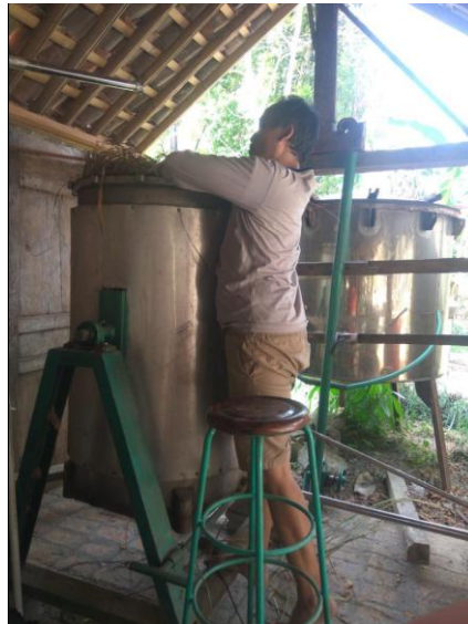
Gambar 7. Proses pemasukan material daun sereh wangi ke dalam reaktor

Material berupa daun sereh wangi tersebut sudah mengalami perlakuan yaitu dilayukan selama lebih kurang 5 jam. Proses selanjutnya adalah memasukkan material daun sereh wangi ke dalam tungku reaktor, seperti terlihat pada gambar 7.