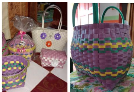
Gambar 3. Kreasi Anyaman

Luaran yang dihasilkan meliputi: produk inovasi dari berbagai macam bentuk kreasi anyaman tali plastik packing sebagaimana ditunjukkan pada Gambar 3 berikut, catatan keuangan pendapatan keluarga penganyam yang diperoleh dari kegiatan menganyam, serta video kegiatan pelatihan.