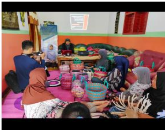
Gambar 2. Pelatihan Pengabdian Masyarakat

anyaman tali plastik. Peserta pelatihan memberikan respon yang positif terhadap kegiatan pengabdian ini sebagai bentuk menambah wawasan dan pengetahuan peserta dalam bidang kreasi anyaman. Kegiatan pengabdian sebagaimana ditunjukkan Pada Gambar 3 berikut.