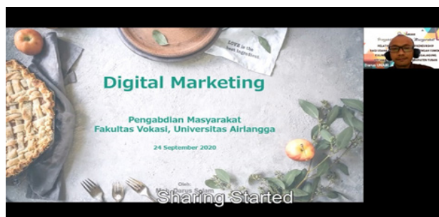
Gambar 3. Instruktur 2 Menjelaskan tentang Digital Marketing

Pada sub materi terakhir, instruktur 2 mendeskripsikan bagaimana mengelola marketplace, khususnya Shopee. Instruktur memaparkan data mengenai nilai bisnis di e-commerce di berbagai industri yang ada di Indonesia meliputi industri fesyen elektronik dan makanan dan minuman. Instruktur memaparkan dengan membagikan tautan yang berisi penjelasan untuk membuat akun Shopee. Instruktur 2 berpesen, dalam mengelola akun media sosial dan marketplace, agar dilandasi dengan pemahaman mengenai konsumen dan berkomunikasi dengan mereka. Pelaku UMKM harus tahu terlebih dahulu siapa target pasarnya, sehingga nantinya UMKM dapat mendesain pola komunikasi dan pemasaran yang baik untuk konsumen dengan karakteristik tertentu dengan cara tertentu.