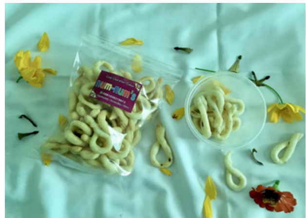
Gambar 2. Foto Produk Makanan Ringan Peserta