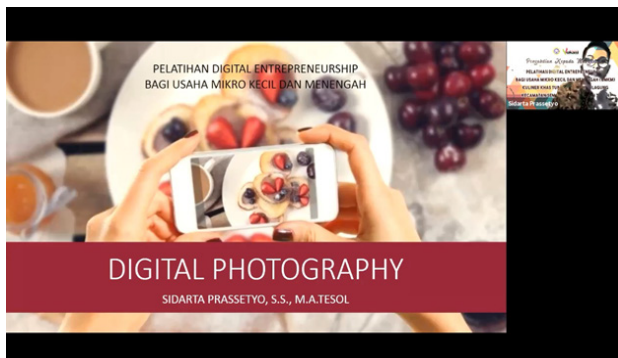
Gambar 4. Instruktur 3 Memaparkan Materi Digital Photography

Para peserta diberikan proyek tugas untuk dikerjakan pada masing-masing materi. Proyek ini bertujuan untuk mengevaluasi sejauh mana para peserta telah memahami dan mampu menerapkan materi yang telah diberikan ke usahanya masing-masing.