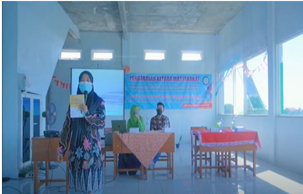
Gambar 3. Pelatihan Penggunaan Aplikasi ATOs-A

Setelah seluruh peserta berhasil menginstall ATOs-A di handphone masing-masing, selanjutnya fasilitator mengajak peserta untuk praktik mendeteksi risiko Osteoporosis menggunakan aplikasi tersebut (Gambar 3).