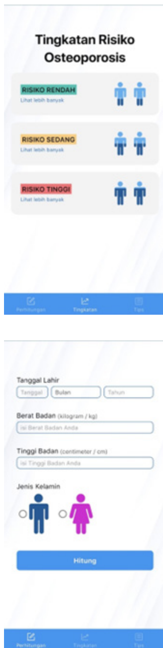
Gambar 1. Aplikasi Airlangga's Tool for Osteoporosis Assessment (ATOs-A)

Aplikasi ATOS-A adalah aplikasi berbasis android yang dibangun berdasarkan metode scoring OSTA (Osteoporosis Skrining Tool for Asians). Aplikasi ini mampu mengklasifikasikan risiko Osteoporosis menjadi 3 kriteria, yaitu risiko rendah, risiko sedang, dan risiko berat. Aplikasi ATOs-A telah melalui uji coba terlebih dahulu sebelum diberikan kepada warga Yayasan Pesantren Umroniyah Kab. Sidoarjo, Jawa Timur. Proses uji coba aplikasi ditujukan kepada sivitas akademika Fakultas Vokasi Universitas Airlangga. Pengguna dapat mengunduh dan menginstal aplikasi ATOs-A