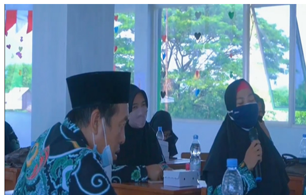
Gambar 2. Peserta Menyampaikan Pertanyaan Kepada Pemateri

Peserta kegiatan penyuluhan dan pelatihan terdiri dari guru yang mengajar siswa berbagai jenjang, tenaga administrasi, dan pengurus yayasan pesantren. Sebelum penyuluhan dimulai, seluruh peserta menjawab kuesioner pre-test guna mengukur tingkat pengetahuan masyarakat terkait Osteoporosis beserta cara pencegahannya. Penyampaian materi dilakukan secara luring oleh dokter spesialis radiologi. Media pembelajaran yang digunakan adalah powerpoint dan buku saku yang diberikan ke seluruh peserta. Selama penyampaian materi, peserta diberikan kesempatan untuk bertanya secara langsung kepada ahlinya. (Gambar 2).